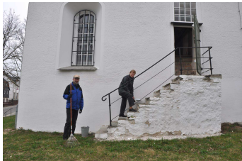
Viele Hände machen ein schnelles Ende.