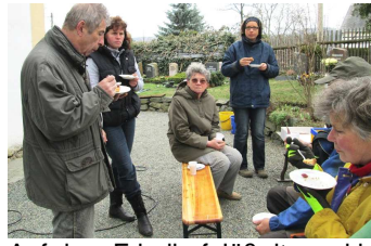
Auf dem Friedhof Jößnitz und in der Steinsdorfer Kirche wurde viel aufgeräumt.