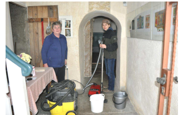
Herzlichen Dank an alle, die sich mit viel Fleiß beteiligt haben.