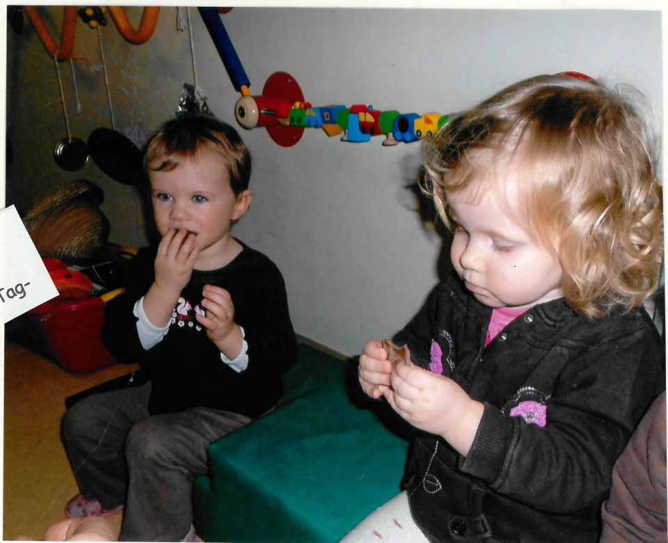
Lecker! -Schokolade am braunen Tag-