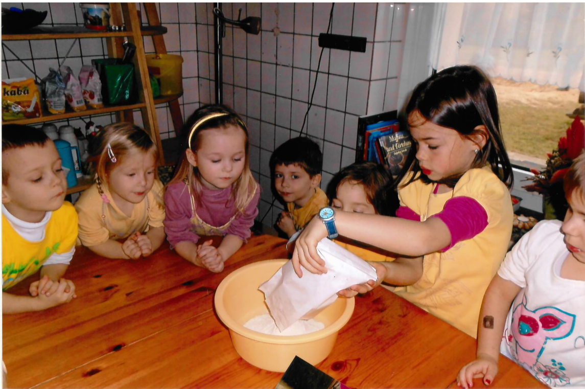
Wir backen einen Papageienkuchen