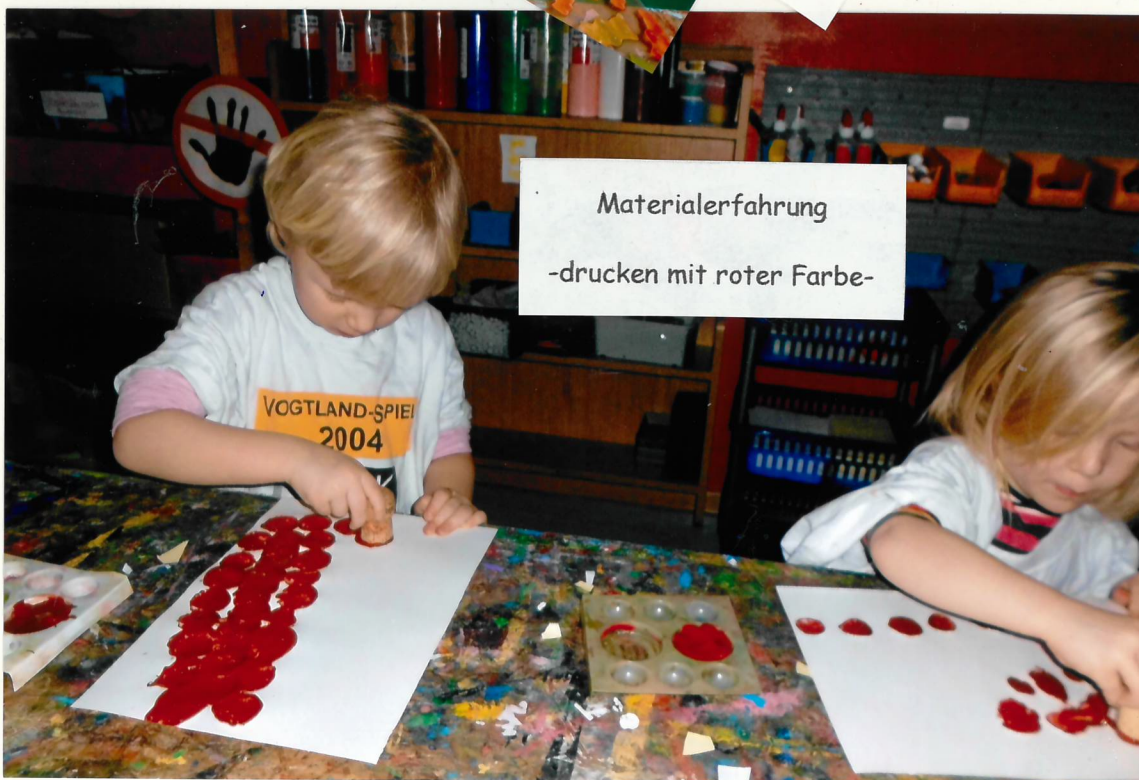
Materialerfahrung -drucken mit roter Farbe-