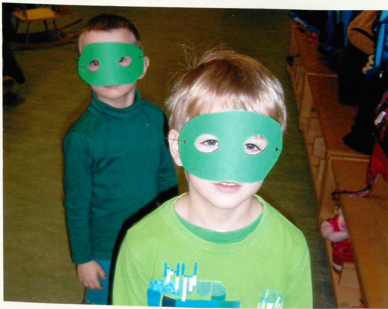
Umgang mit der Schere