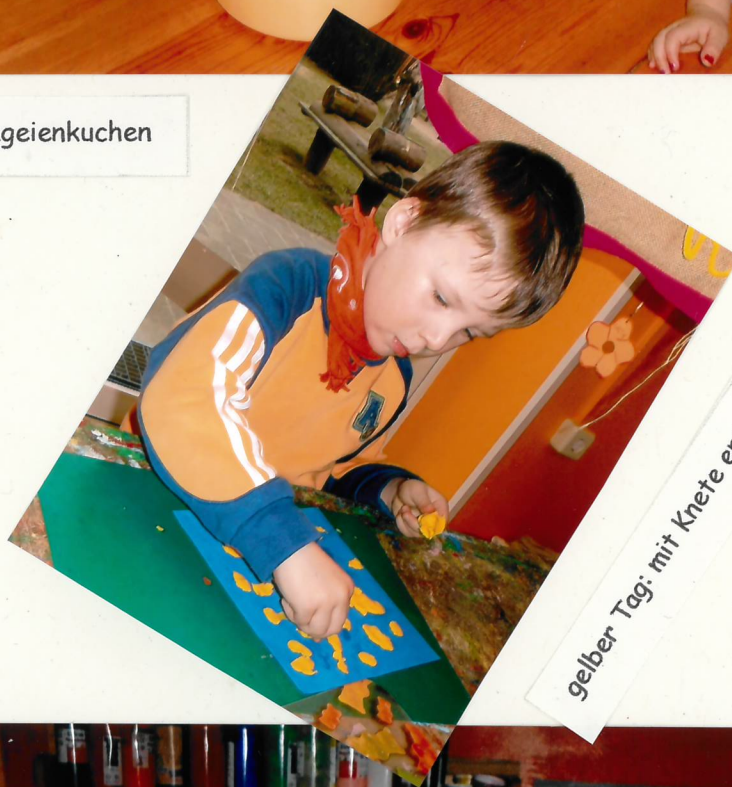
gelber Tag: mit Knete entsteht eine Sonne