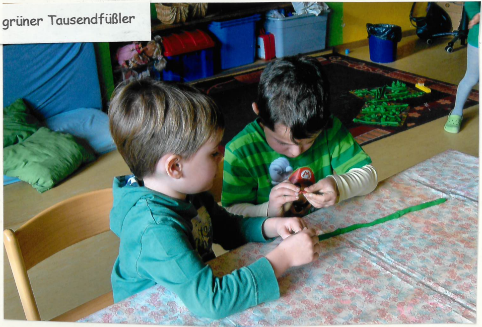
Gemeinschaftsarbeit: ein grüner Tausendfüßler