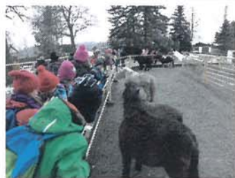
Im Tierpark Klingenthal