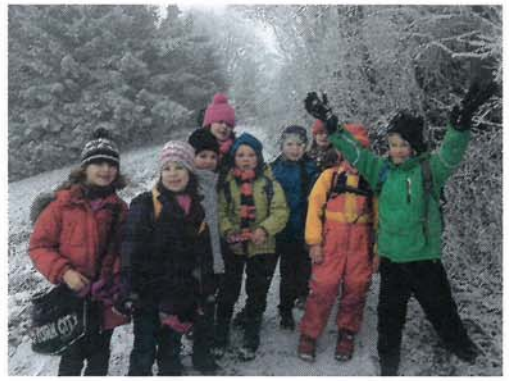
Juhu, es schneit...