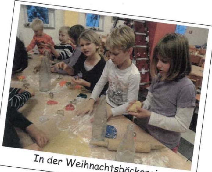
In der Weihnachtsbäckerei