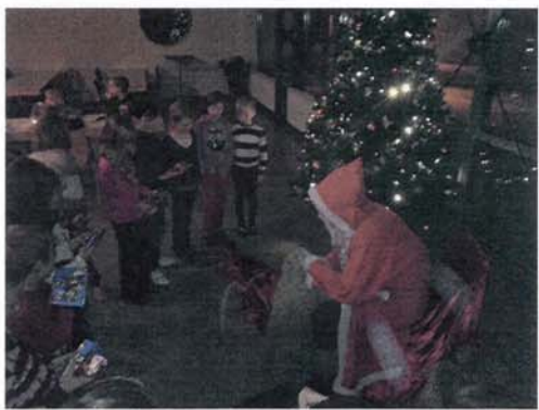
Besuch vom Weihnachtsmann