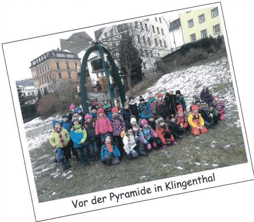
Vor der Pyramide in Klingenthal