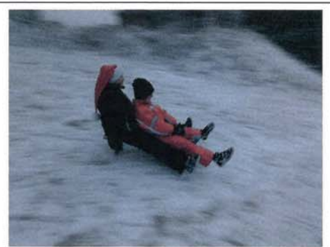
Bahn frei, Kartoffelbrei ...