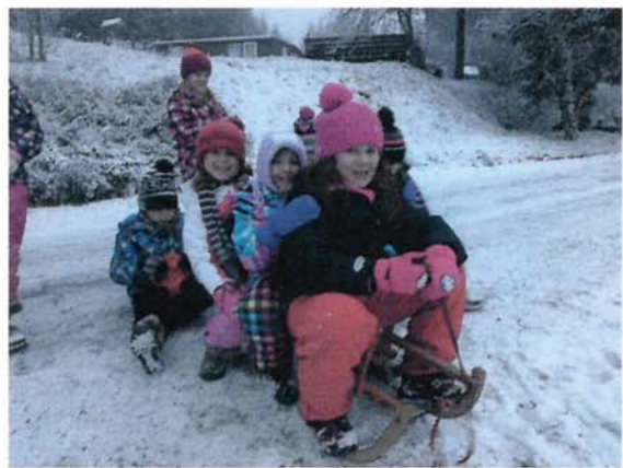
Los, lass uns rodeln gehen!