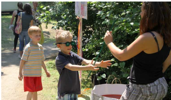
Viele Kinder waren treffsicher wie das tapfere