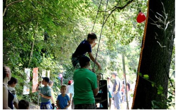
Aus Märchen konnten auch noch die Eltern lernen.

Herzlichen Dank für weitere Bauspenden: bis 12.7. 27.365,66 €