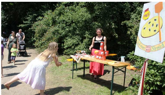
Schneiderlein und fleißig als Goldmarie.