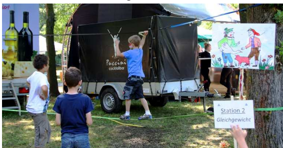
Rapunzel und Froschkönig war Geschicklichkeit gefragt.