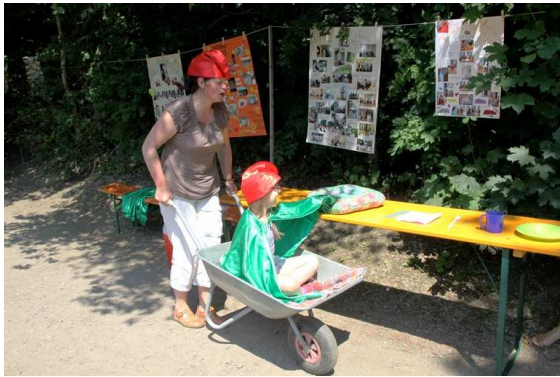
Bei den sieben Zwergen, Hans im Glück,