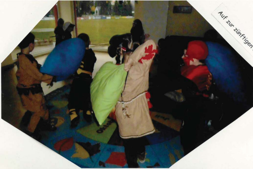
Auf zur zünftigen Kissenschlacht!