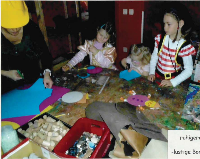
ruhigere Faschingsaktivitäten -lustige Bonbonmännchen entstehen-