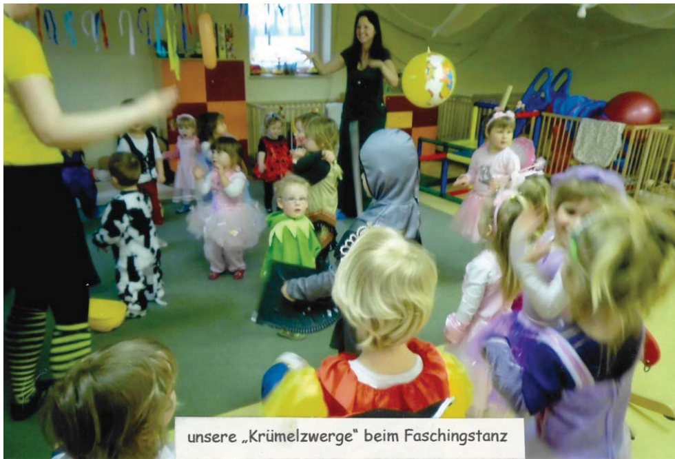
unsere „Krumelzwerge“ beim Faschingstanz