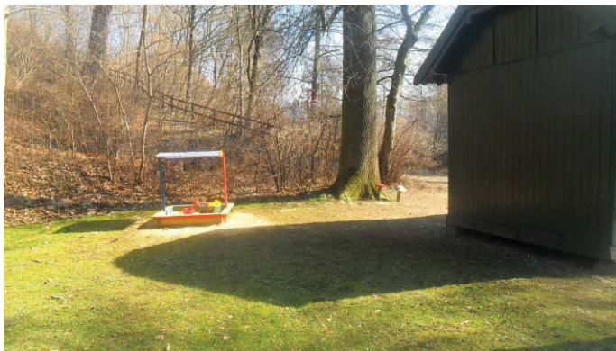
Sandkasten am Badehäuschen