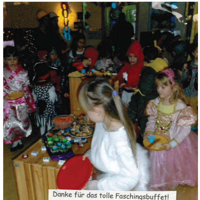
Danke für das tolle Faschingsbuffet!

Ob beim Luftballontanz, bei einer zünftigen Küssenschlacht, beim Stuhlwalzer oder aber bei etwas ruhigeren Faschingsaktivitäten, es fand ganz bestimmt jeder etwas, um so richtig Fasching zu feiern.