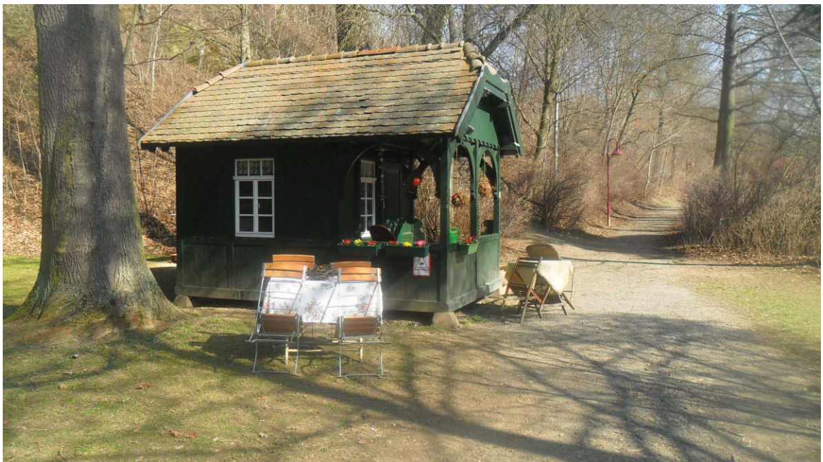
Das Badehäuschen lädt zum Verweilen ein