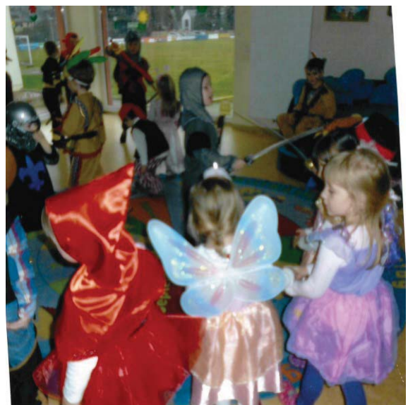
unsere Ritter beim Ritterkampf