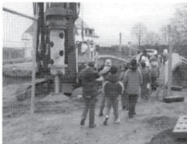
Nein, hier werden keine Blumen gepflanzt.

Dann wollten wir es genau wissen. Welche Frühblüher wachsen denn nun bei uns? Diese und weitere Fragen sollte uns ein Fachmann beantworten. So führte uns unser erster Unterrichtsgang in diesem Jahr zur Gärtnerei Elßner.