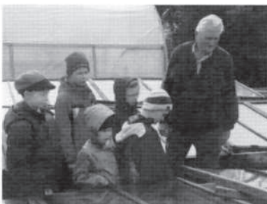
Was wird da wohl "versteckt" sein.