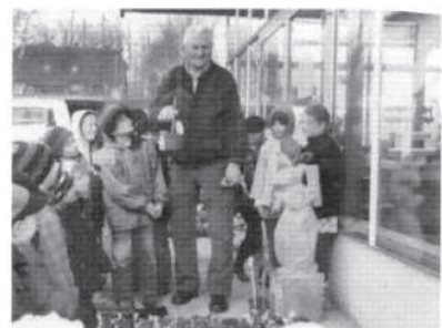
Wir wurden schon erwartet. Na, was ist das?