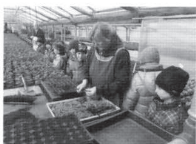
Jetzt wissen wir endlich was "pikieren" bedeutet.