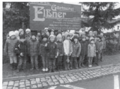
Schon am Ziel, das war ein Klacks.