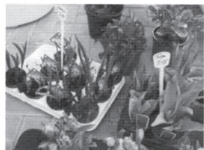
Im Garten suchen, kaufen oder selbst pflanzen?