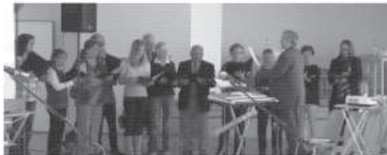
Liturgische Gestaltung durch den Chor