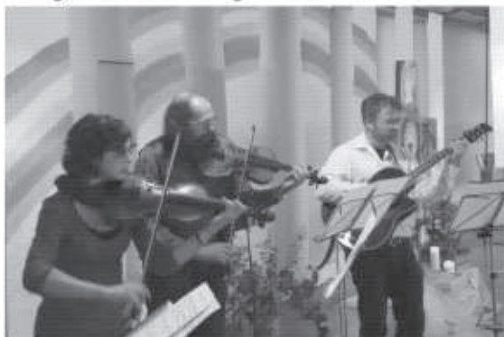
Tafelmusik zum Mittagessen