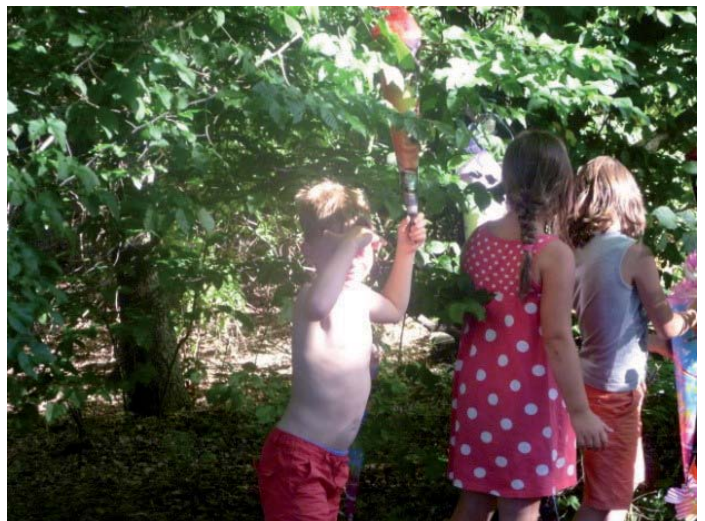
Der Zuckertütenbaum wurde gefunden