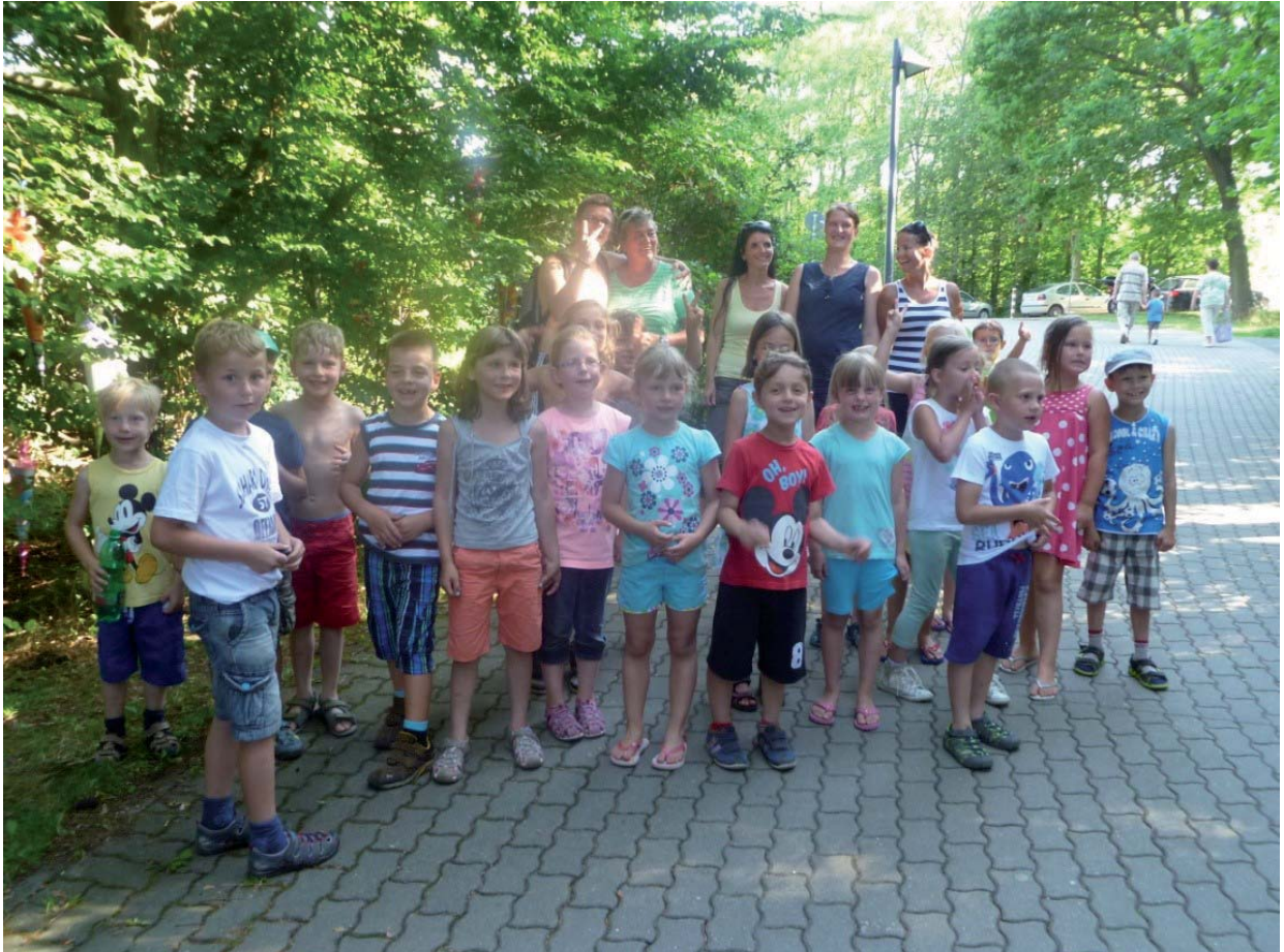
Das sind unsere Schulanfänger 2014