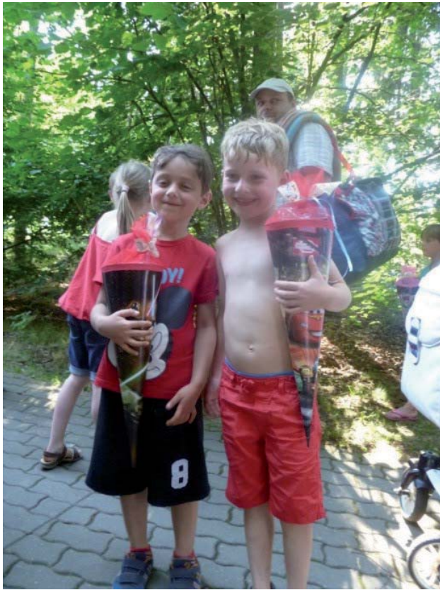
Letztes Bild mit Zuckertüte