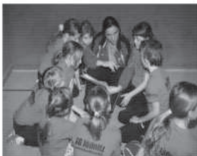
Einweisung in den Ablaufplan