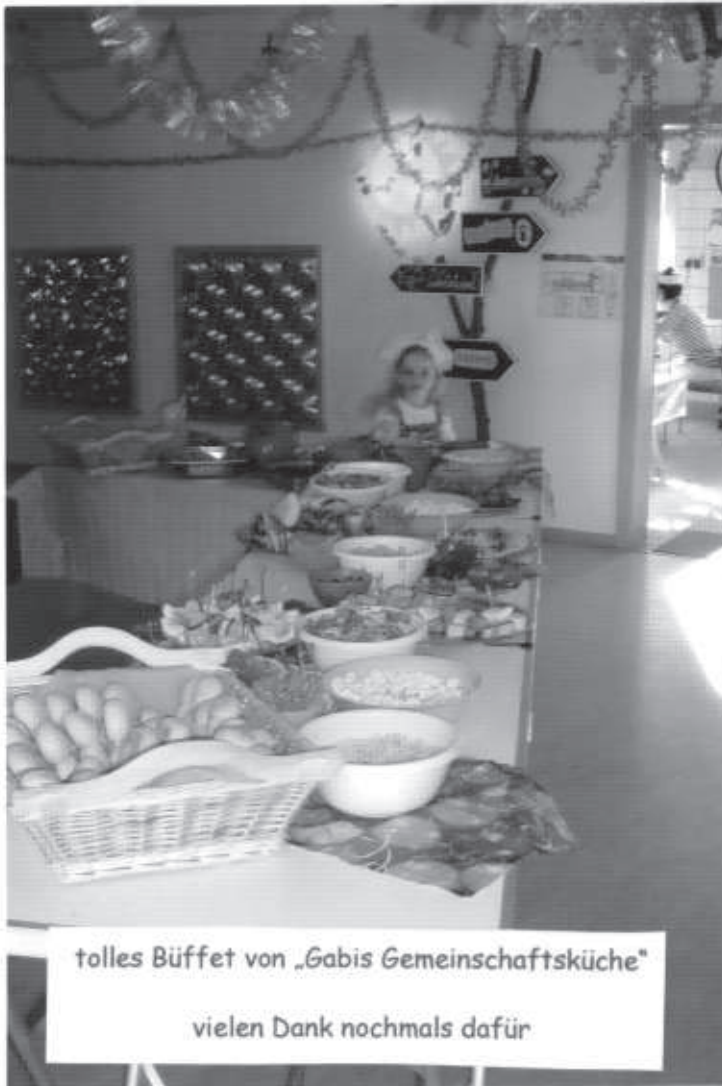
tolles Büffet von „Gabis Gemeinschaftsküche“

Natürlich gehörte auch ein Faschingsumzug durch Jöbnitz dazu. Und dieser führte uns direkt durchs Seniorenzentrum „Salus“, wo schon für jedes Kind ein leckerer Krapfen zum Vernaschen wartete, vielen Dank nochmals. Unsere Faschingsfeier ging viel zu schnell vorbei, aber wir haben ja einen Trost, nächstes Jahr ist auf alle Fälle wieder Fasching! Anbei noch ein paar Schnappschüsse von uns und der Feier und bis bald die „Gänseblümchen“.