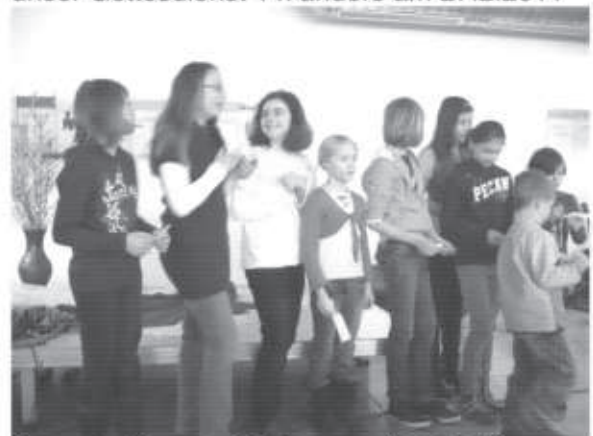
Konzert: Oranges Voices am 12.3.2011

Bilder zum Rückblick: Kinderbibeltage und unser Gottesdienst 1 x anders am 27.2.2011