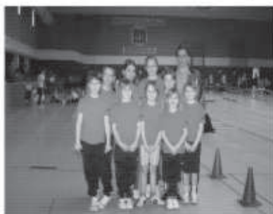
Starter der SG Jöbnitz