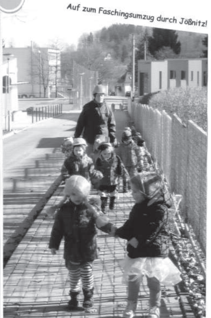
Auf zum Faschingsumzug durch Jöbnitz!