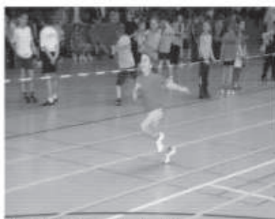
Muriel Pfeiffer beim Sprint