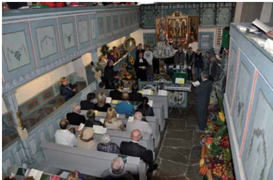
Die Konfirmanden trugen ein Lied vor und ließen von ihrer Rüstzeit berichten.

Neben Erntegaben schmückten auch Bilder aus dem Steinsdorfer Kinderkreis die Kirche.