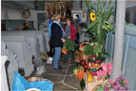
Am 13. September wurden Gaben gesammelt. Kinder zogen in Steinsdorf von Hof zu Hof.