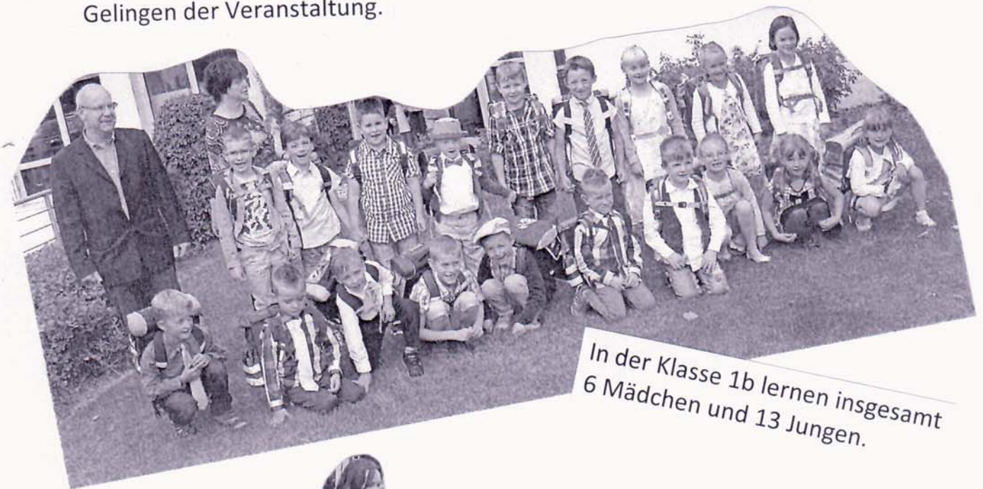
In der Klasse 1b lernen insgesamt 6 Mädchen und 13 Jungen.

Herzlichen Dank gilt den Kindern der zweiten Klassen mit ihren Lehrern für das schöne Programm, der Feuerwehr Jöbnitz für das Bringen der Zuckertüten und der Bildungsstätte mit Herrn Herold für die freundliche Unterstützung zum Gelingen der Veranstaltung.