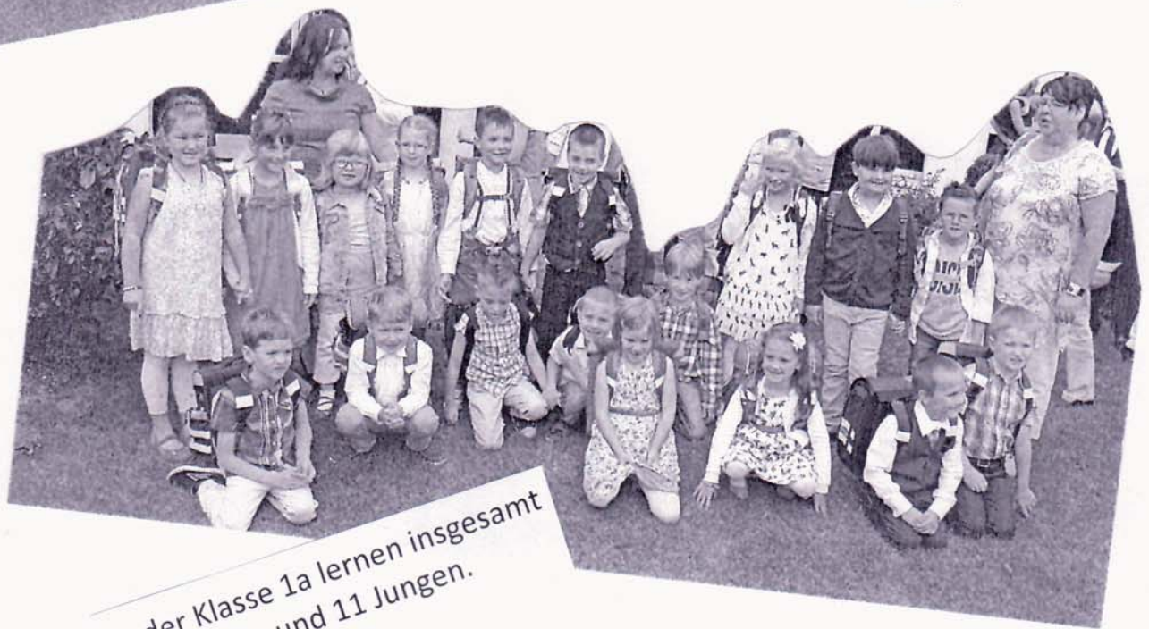
In der Klasse 1a lernen insgesamt 7 Mädchen und 11 Jungen.