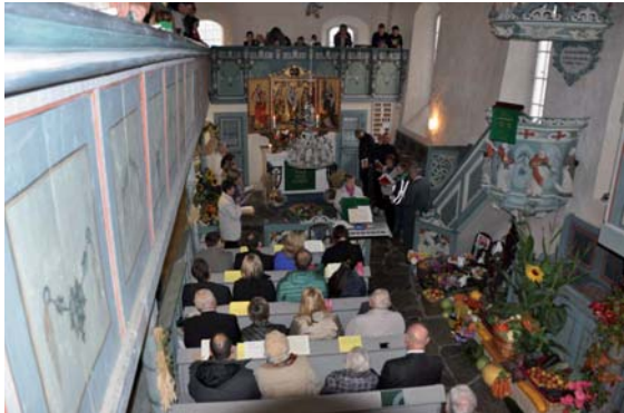
Der Kirchenchor Jößnitz erfüllte die Kirche mit Gesang.